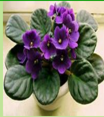
Фиалки с разной окраской цветков.