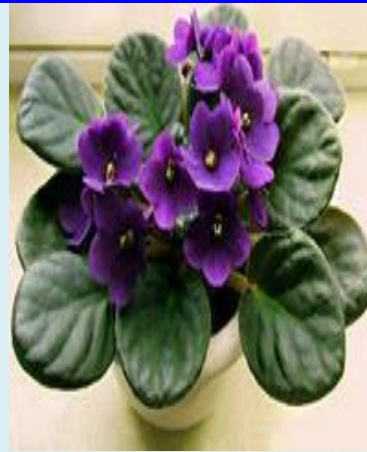
Фиалки с разной окраской цветков.